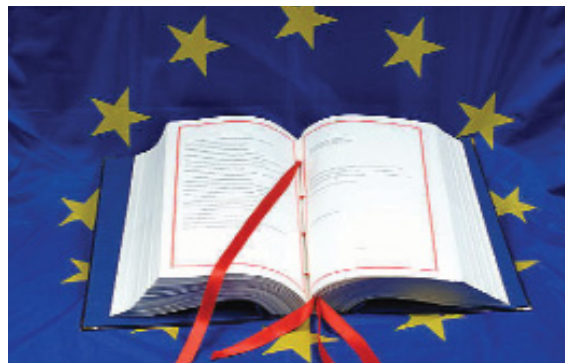
Слика 3. Лисабонски уговор

безбедности и одбране, независно од НАТО-а, али и у сарадњи с том организацијом.