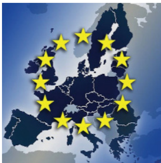
Слика 1. Европска унија