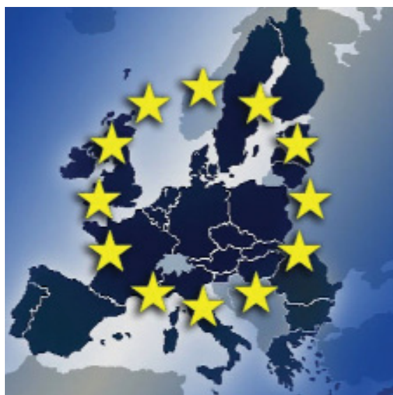
Слика 1. Европска унија