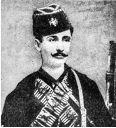
Војвода Војислав Танкосић

вима и после окончања анексионе кризе. Део њих постали су тајни повереници Народне одбране и прикупљали обавештајне податке о аустроугарској војсци, а многи од њих били су и повереници (агенти) војнообавештајне службе Србије. Њиховим шпијунским радом руководили су надзорни (обавештајни) гранични официри који су се налазили у Шапцу, Лозници и Ужицу. Након формирања тајног удружења Уједињење или Смрт, познатијег као Црна Рука (у мају 1911), многи надзорни официри били су чланови тог удружења. Они су, у складу са циљевима и програ-