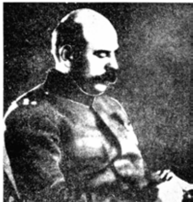
Пуковник Драгутин Т. Димитријевић – Апис

лука Владе у Нишу 7. августа 1914. „да Врховна команда може купити чете добровољачке и употребити их по своме нахођењу, но, да су под командом наших официра и то најдисциплинованијих... Добровољци се нарочито могу употребити у Босни за дизање устанка” 25 .