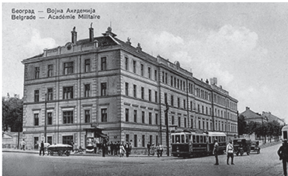
Стара зграда Војне академије, Београд 1934. године

нерали и министри. Чин поручника Јован Драгашевић добио је 30. августа 1862, чин капетана 1. јануара 1866, а чин капетана I класе 1870. године. У чин мајора унапређен је 1. марта 1874, у чин потпуковника 10. октобра 1876, а у чин пуковника 1. децембра 1880. године. Пензионисан је 28. априла 1888. године. Звање почасног генерала додељено му је 23. јула 1900. са правом ношења униформе тога чина. После пензионисања наставио је са књижевним и научним радом. Писао је за новине, а покренуо је и лист „Дарданија”. Умро је у Нишу, годину дана после прве агресије Аустроугарске на Србију, 1915. године. Сахрањен је 7. јула у Београду.