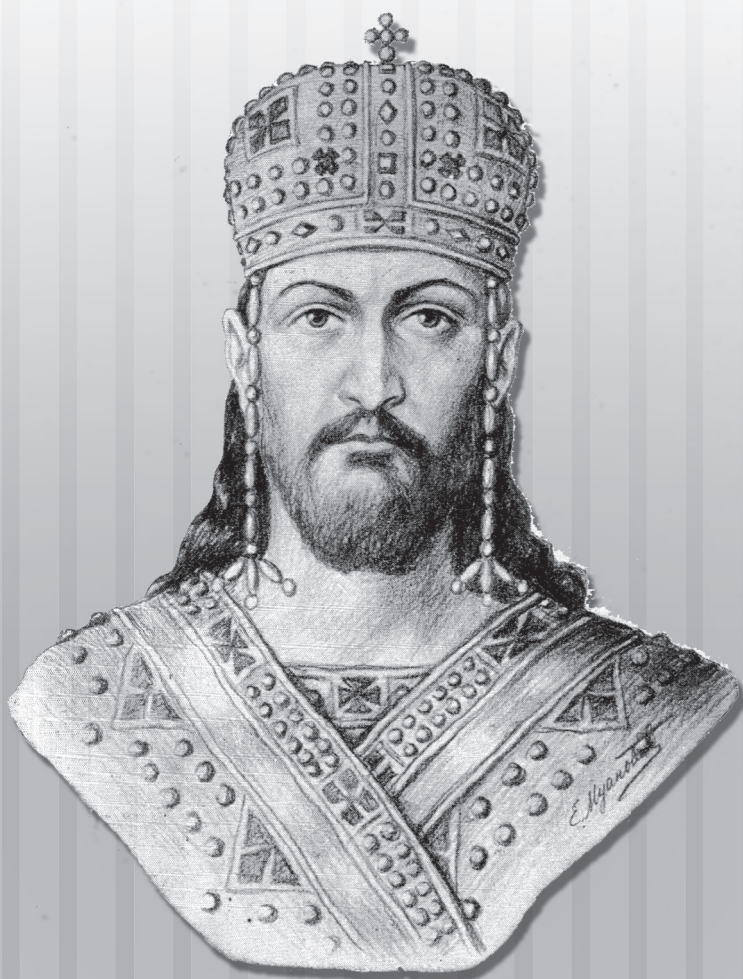
Цар Душан Силни