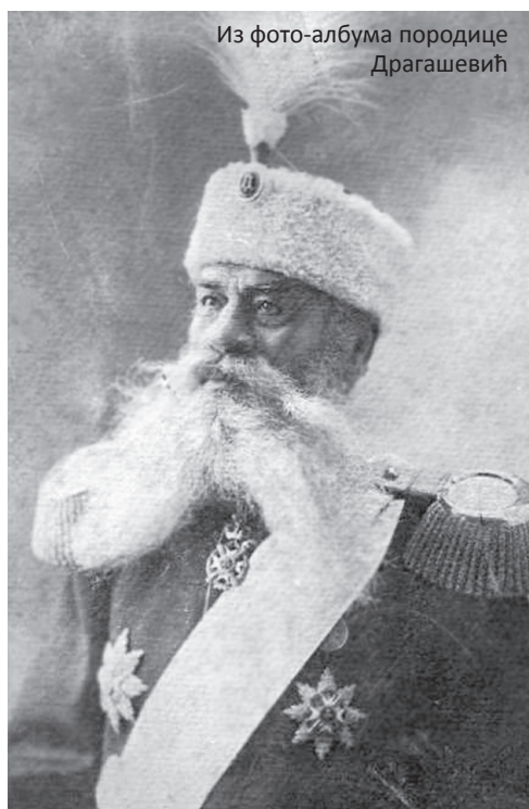
Из фото-албума породице Драгашевић