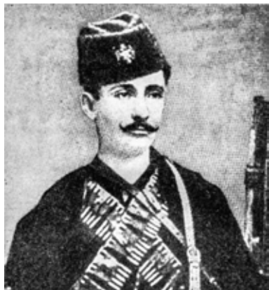
Војвода Војислав Танкосић

вима и после окончања анексионе кризе. Део њих постали су тајни повереници Народне одбране и прикупљали обавештајне податке о аустроугарској војсци, а многи од њих били су и повереници (агенти) војнообавештајне службе Србије. Њиховим шпијунским радом руководили су надзорни (обавештајни) гранични официри који су се налазили у Шапцу, Лозници и Ужицу. Након формирања тајног удружења Уједињење или Смрт, познатијег као Црна Рука (у мају 1911), многи надзорни официри били су чланови тог удружења. Они су, у складу са циљевима и програ-