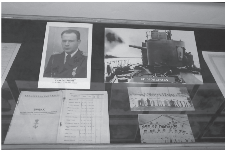
У холу испред спомен-собе Речне флотиле налази се витрина посвећена монитору „Драва“ и његовој посади