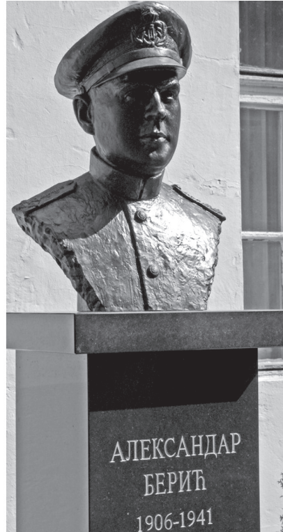
На гробу у Белегишу и испред спомен-собе Речне флотиле постављене су бисте хероја Априлског рата