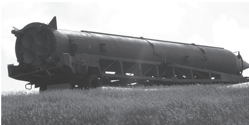
Р-12 Совјетска балистичка ракета средњег домета

Свет данас стрепи слично као у време ракетне кризе, с тим да је могућност од нуклеарне катастрофе већа будући да је повећан број земаља које поседују нуклеарно оружје. И данас је, као и тада, актуелан дијалог између Истока и Запада. Нови поредак који се успоставља под патронатом САД изнедрио је нове облике угрожавања безбедности, од разних терористичких организација до нацифашистичке идеологије.