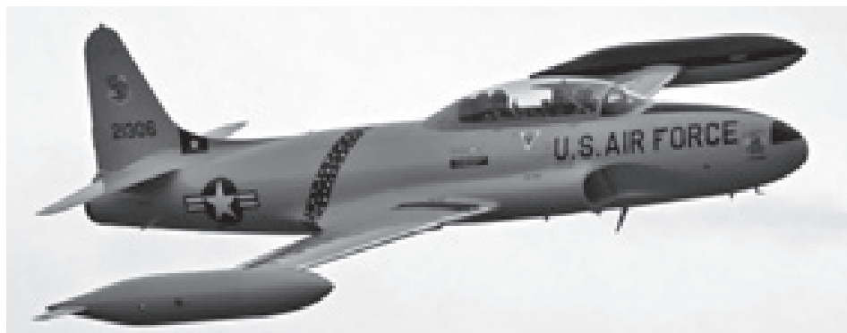
Авион Т 33

Грешке америчке политике према Куби довеле су, дакле, напоследку до тога да она падне у руке њиховим највећим хладноратовским непријатељима. А последице тих грешака посебно ће се испољити у периоду ракетне кризе на Куби.