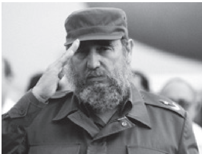
Бивши председник Кубе Фидел Кастро

Оно што ову револуцију чини специфичном јесте чињеница да је бројчано мања и слабија група герилаца, коју је предводио Фидел Кастро, успела да победи режим на власти и поред техничке инфериорности, захваљујући доброј герилској стратегији и ослањању на народне масе, поставши тако узор другим револуционарним покретима у свету. Централна личност револуције свакако је Фидел Кастро, који је уједно био и њен главни покретач и организатор.